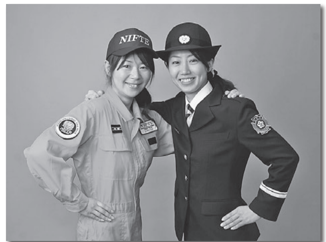
▲女性団員に貸与される活動服と制服

申問 5月15日(日)までに、電話で市消防本部総務課消防担当（☎56・6250）へ。募集人員に満たない場合は、随時受け付けます。