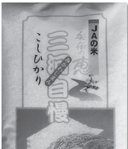
米（減農薬ブランド米）