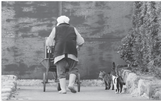
『佐久島・イメージ』の中の1シーン 「島民と猫」の風景

佐久島は年間の平均気温が15度前後と比較的温暖な土地ですが、3月ごろまでは離島特有の強い西風が吹くため、体感温度は低く感じます。しかし、花の姿とその香りから春を感じることが出来ます。春だけでなく季節ごとに姿を変える島の自然や景観などは、訪れる人に懐かしさ、あるいは新鮮さを感じさせます。