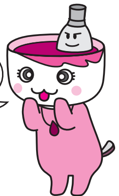
西尾市観光協会 マスコットキャラクター 「まーちゃ」