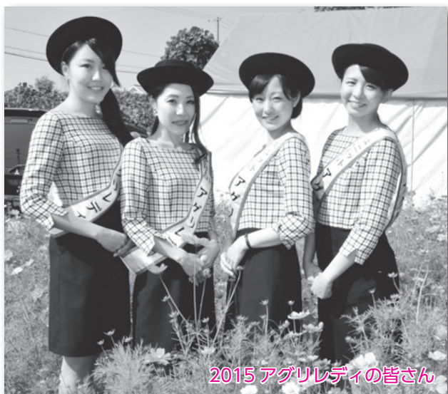
2015 アグリレディの皆さん

対 県内在住の18歳以上の女性（年齢は28年4月1日現在。高校生を除く）で、農業関連イベントなどに参加できる方。自薦・他薦、既婚・未婚は問いません。未成年者は親権者の承諾が必要 ※他のミスなどとの重複就任はできません。