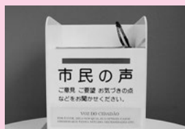
投書箱（設置場所により形が異なります）