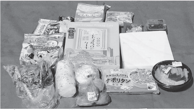
ごみステーションに捨てられたごみの中身。多くの食品ロスが含まれています

簡単な心掛けで食品ロスは減らせます。食品ロスを減らせば、家計の負担が少なくなるかもしれません。 問 ごみ減量課ごみ減量担当 ☎34・8113 / クリーンセンタール内