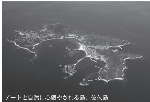
アートと自然に心癒やされる島、佐久島

佐久島小・中学校では豊かな自然環境や島に住む皆さんとの温かいふれあいの下、基本的な生活習慣と確かな学力を身に付けるため、一人一人が主役となる少人数授業を実施しています。