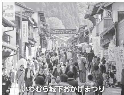
いわむら城下おかげまつり

対 市内在住の18歳以上の方 時 11月5日(日) 午前9時集合、午後4時30分帰着予定 集合場所 市役所北側駐車場 内 西尾藩ゆかりの里として、友好都市の提携を結んでいる岐阜県恵那市岩村町を訪問。いわむら城下おかげまつりを見物したり、町並み