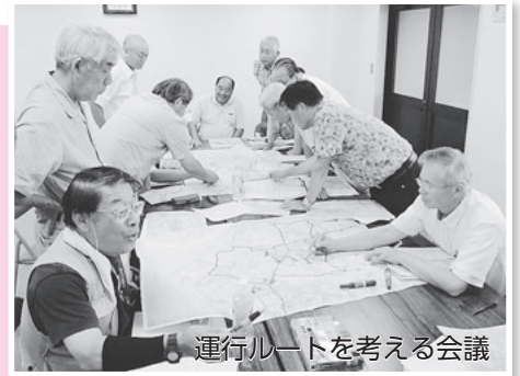
運行ルートを考える会議

10月1日から、いっちゃんバスの運行が始まります。一色地区では、利用者の少ない鉄道の廃線という苦い過去があり、運行開始がゴールではないと思っています。多くの方に利用していただき、皆さんの手でいっちゃんバスを育ててほしいです。また、利用した際には、ぜひ意見を聞かせてください。地域の声でどんどん使いやすいバスにしていきたいと思います。