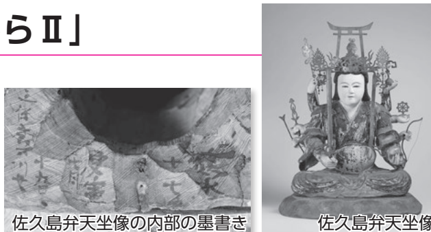
佐久島弁財天坐像の内部の墨書き