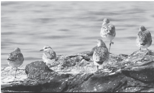
大浦海水浴場の岩場で休息するオオソリハシギの群れ