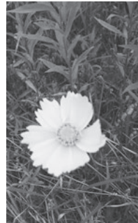
オオキンケイギク

6月24日に、環境学習講座「外来生物ってなに? I」が開催され、参加者は外来植物について学びました。「オオキンケイギク」という花をご存知ですか? 5月中旬から6月にかけて河川の土手などに咲く黄色いコスモスのような花で、土手一面に咲いている所もあり、とてもきれいな花です。