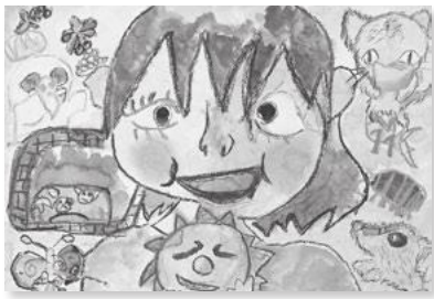
28年度教育長賞受賞作品