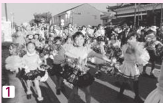
1 元気ッス！へきなん