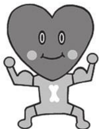
市食育キャラクターハートン

講 西三河地区漁業士協議会 申 問 7月13日(木)までに、郵便番号・住所・参加者全員の名