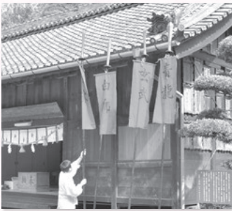
現在使われている四神矛

新しく発見された資料には、西尾の歴史・文化に関する新しい発見の可能性が詰まっています。古文書などの資料がありましたらお知らせください。