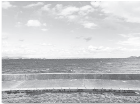
「星を想う場所」が設置される高千谷海岸から見た景色

佐久島にあるアート作品は素材・テーマともに、多岐にわたる制作の手法がある現代美術に分類されます。アーティストは特性のある島の文化や自然、空き家などもテーマとして、いろいろな切り口で作品を制作しています。そんな作品の一つ、島の北側の高千谷海岸にある「星を想う椅子」が6月24日(土)、「星を想う場所」に生まれ変わります。