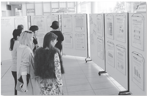
男女共同参画を啓発するパネル展

男女共同参画社会の実現のためには、人々の意識や地域社会の制度、慣行などを見直し、地域の風土や歴史、慣習、住民の意識などを把握した計画を策定することが必要です。西尾市では男女共同参画の方向性を定めた「男女共同参画