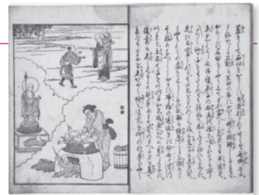
かまのじぞうれいげんき 釜之地蔵霊験記

申問 6月3日(土)午前9時から、直接または電話で岩瀬文庫(☎56・2459)へ。