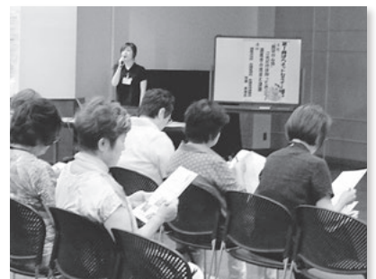
ばらネットセミナー

西尾市は男女共同参画推進事業を市民活動グループばらネットと協働で行っています。ばらネットは市内で活動する8団体と個人会員で構成されます。ワーク・ライフ・バランスを考えるさまざまなテーマでセミナーを開催し、地