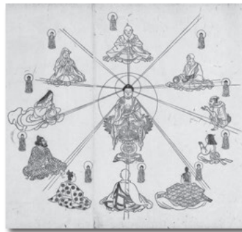
『融通念仏縁起絵』 岩瀬文庫蔵／江戸時代

「融通念仏」という教えに従えば、どんな人も阿彌陀如来から恵みを受けられることを分かりやすく表した図。縁起の多くは、難しく不思議な神仏の教えを、絵や文で分かりやすく表します。