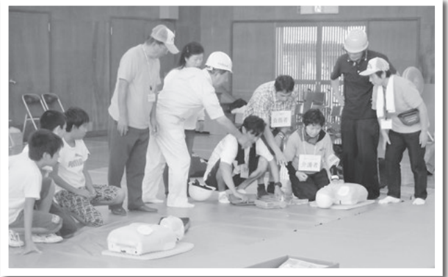
一色中部小学校で行われた防災訓練で AEDの操作方法を指導する自主防災会

ことが重要です。地域・近隣の市民同士が連携することの必要性を再認識し、地域コミュニティの活性化に努めましょう。