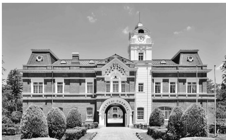
シャトーカミヤ旧醸造場施設・事務室 このほか醗酵室と貯蔵庫が国の重要文化財に指定されています

この新コーナー「にしおのおっ!」は、広報担当が「おっ!」と感じた西尾にまつわるヒトやモノなどについて、独自に取材をしてお届けします。「お知らせ」のスペースに左右される不定期コーナーですが、これからよろしくお願ひします。