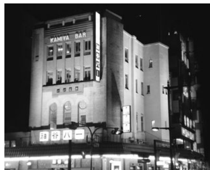
神谷バー 現在はバーのほか、レストランや割烹(和食レストラン)もあります

谷傳兵衛が明治36(1903)年に「牛久醸造場」として建設したものです。傳兵衛は安政3(1856)年に松木島村に生まれました。生家は資産家でしたが、父親が多趣味で家事を顧みなかったため、幼少時代は貧しい暮らしを送りました。18歳になると傳兵衛は横浜に出て、居留地の外国人が経営する酒類醸造場に職を得ました。その後、東京に移り、明治13(1880)年に洋酒を1杯売りする「みかはや銘酒店(現神谷バー)」を浅草に開店。この店を成功させた傳兵衛は次にワイン醸造に乗り出し、その後もさまざまな事業に関わりました。傳兵衛は郷土への思いも厚く、自身も設立に関わった三河鉄道株式会社で財政危機に陥ったときには進んで取締役社長に就任し、会社の立て直しに奔走しました。大正