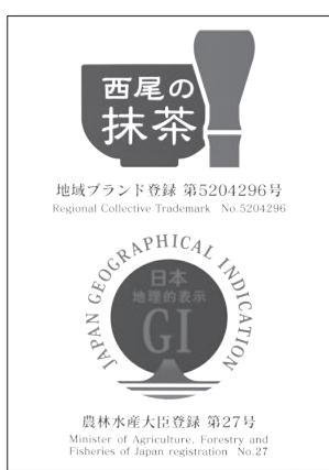
県内で初めて地理的表示(GI)に認定された「西尾の抹茶」

携帯電話などを利用して、名鉄西尾駅から歴史公園へ迷わず行けるよう、外国人にも対応した案内板を設置します。市観光協会による宿泊・食事プランのほか、潮干狩り・抹茶体験などの地域資源を活用した事業や、佐久島などを巡るツアーを実施