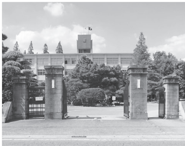
愛知県立西尾高校正門門柱／旧愛知県西尾中学校の正門として昭和5年ごろに建築。柱頭部の装飾がアカンサスの葉を模しているのが特徴