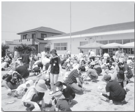
みんなで協力して芝生を植栽(寺津保育園)

八ツ面保育園や一色保育園など5園のトイレ洋式化工事のほか、吉田保育園の外部改修工事や見影保育園の屋上防水改修工事を実施します。老朽化が著しい西野町保育園の移転改築に向けた測量業務も予定しています。芝生化事業を26の保育園・幼稚園と、10の小学校で実施してきます。29年度は、花ノ木保育園や東幡豆保育園など7園と西尾中学校で実施します。