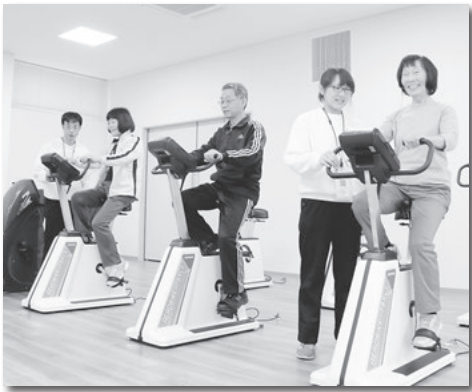
西尾市民げんきプラザを4月に開設

健康寿命を延伸し、介護予防を推進する拠点として「西尾市民げんきプラザ」を開設します。65歳以上の高齢者と40歳以上のメタボリックシンドロームの方などを対象に、問診や体力測定などの実施や、一人一人