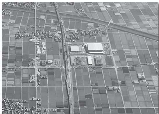
企業立地が進む岡島江原流通業務団地

職員による企業訪問や、東京都での大規模展示会への市内企業との共同出展、昨年11月に開催の産業立地セミナーなどで企業用地や企業立地優遇制度などの積極的なPRの結果、県内トップクラスの実績を誇っています。引き続き、本市への投資を促進し、市内企業の「競争力」や「稼ぐ力」のきっかけを提供するため、展