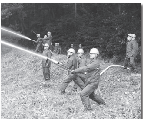
機能別消防団による放水訓練

昨年10月に機能別消防団を旧西尾市に設置しました。この機能別消防団と旧三町の消防団が、大規模な災害時に全市的な活動を行えるよう組織の強化に努めます。計画的に整備する耐震性貯水槽を、吉良町友国地内と吉田地内の2か所に設置します。防災対策では、まず自らがその生命や財産を守る「自助」と近所や地域で助け合う「共助」が大切です。市民や地域とのネットワークを強化し、ソフト面でも災害に強いまちづくり