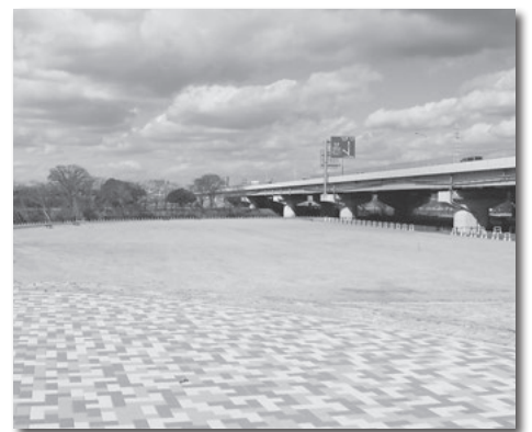
緑あふれる憩いの場「岡ノ山遊ぼっ茶広場」

24年度から矢作古川左岸で整備を進めてきた「岡ノ山遊ぼっ茶広場」が4月にオープンします。バーベキュー場18サイト、芝生広場3か所、遊具広場などを備えるこの公園が笑顔と元氣、緑あふれる市民の憩いの場となることを期待しています。29年