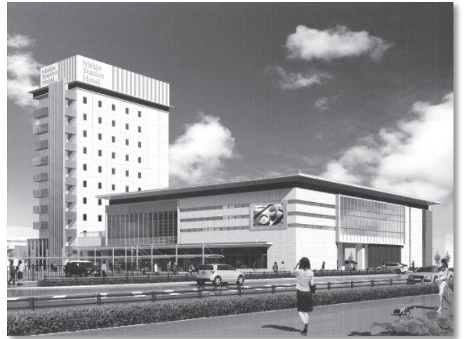
コンベンションホール棟(右)とホテル棟(左)の完成予想図