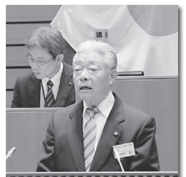
施政方針を演説する 榊原康正市長

西尾市のまちづくりも地道に、愚直に、そして果敢に進めていかなければなりません。少子高齢化など刻々と変化する社会情勢や多様化する市民ニーズに的確に対応し、常に目標を立て、夢や希望のある未来を展望するとともに、17万市民が安心して住み続けられる、進化し続ける「ふるさと西尾」の実現に向けて全身全霊で市政運営に取り組みます。