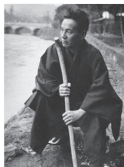
※旧糟谷邸と共通。高校生以上

内 東京へ移る昭和29年までの10年間を過ごした静岡県伊東での創作活動や、伊東在住の文化人や地元の文学青年たちとの交流などを紹介 入館料 300円