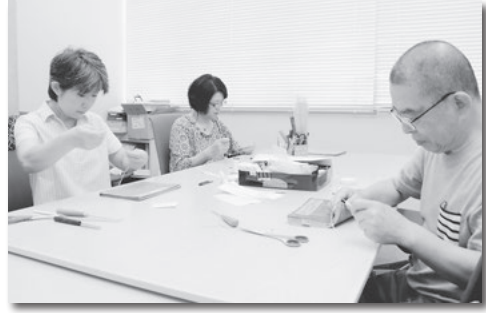
和装本の修復作業を行うボランティア