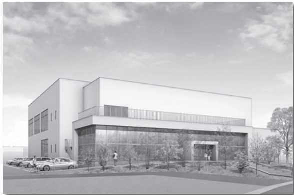
30年度オープン予定のきら市民交流センター支所棟

官民連携手法である西尾市独自のPFI事業として進める公共施設再配置第1次プロジェクトは、計画した事業スケジュールに基づき、専門家による技術的な支援を受けながら適切な行政モニタリングを実施し、着実に推進してまいります。29年度は、さら市民交流センター支所棟の建設に着手し、30年度のオープンを目指すほか、アリーナ棟の設計に着手します。また、一色町公民館を改修し、一色支所機能を移転するほか、一色支所跡地に建設を予定している多機能型市営住宅などの設計にも着手します。このほか、31〜35年度の5年間に着手すべき再配置プロジェクトを定める第2次公共施設再配置実施計画の策定に向けて本格的に取り組んでいきます。