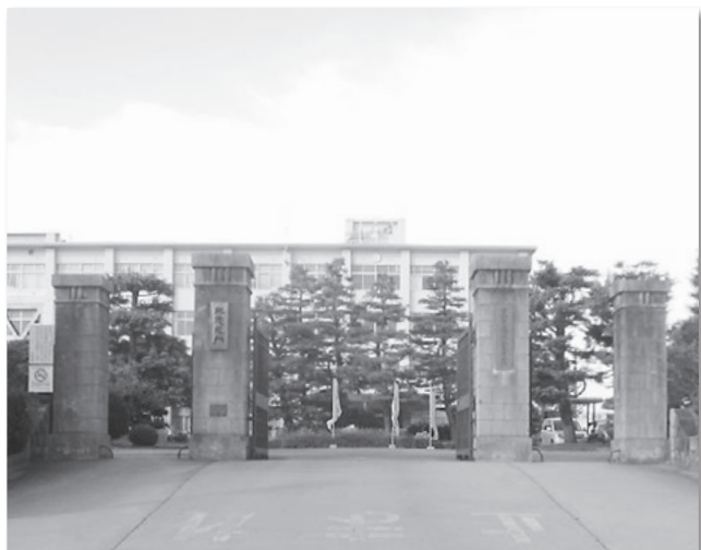
愛知県立鶴城丘高校正門門柱／旧愛知県蚕糸学校の正門として大正14年ごろに建築。セセッション風意匠が特徴

3月10日に行われた国の文化審議会で、「愛知県立鶴城丘高校正門門柱」と「愛知県立西尾高校正門門柱」を国の登録有形文化財とするよう答申が出されました。今後、官報告示を経て登録されます。共に鉄筋コンクリート造で、戦前に建てられた威厳のある校門の意匠が評価されました。