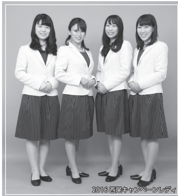
2016西尾キャンペーンレディ

申 5月8日(月)(必着)までに、応募用紙と3か月以内に撮影したL判の全身写真を直接または郵送で西尾観光案内所（〒445-0851住吉町4丁目18-4/名鉄西尾駅構内）へ。応募用紙は同所と市商工観光課に用意。市観光協会ホームページでダウンロードもできます。