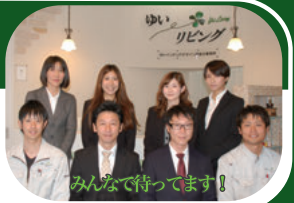
みんなで行ってます!