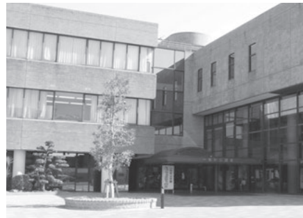
一色町公民館・一色地域交流センター

問 生涯学習課施設担当(☎55・3515/中央ふれあいセンター内)、一色町公民館(☎72・3411)