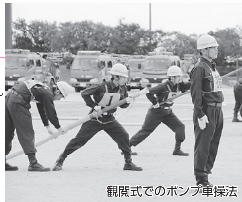
観閲式でのポンプ車操法

っています。 ※機能別消防団と、一色・吉良・幡豆の各消防団は活動内容が一部異なります。