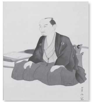
頼山陽肖像画 (頼山陽史跡資料館蔵)