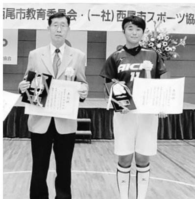
優秀選手の皆さん