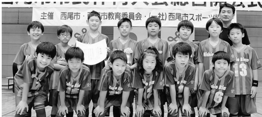
優秀チームの皆さん