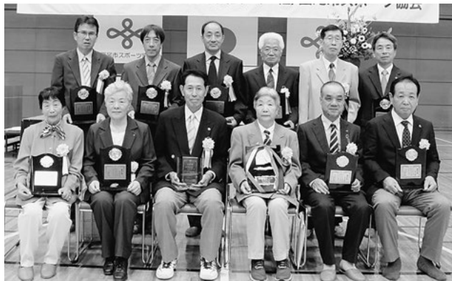
特別体育功労者・体育功労者・特別優秀チーム代表者の皆さん

▶ 優秀チーム …西尾ブレイズ(市ドッジボール協会) 問 スポーツ課振興担当 (☎54・0002/総合体育館内)