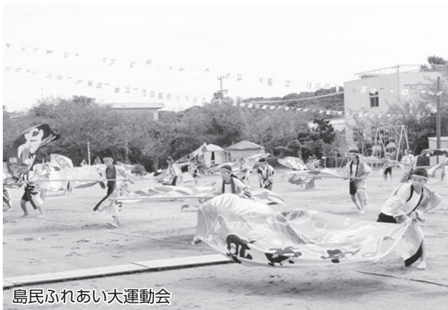
島民ふれあい大運動会

佐久島小・中学校では、豊かな自然環境や島に住む皆さんとの温かいふれあいの下、基本的な生活習慣と確かな学力を身に付けるため、一人一人が主役となる少人数授業を実施しています。