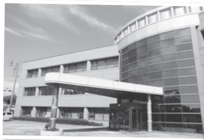
吉良保健センター