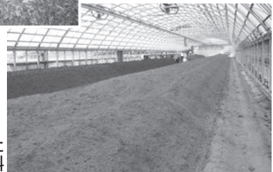
剪定枝からできた有機肥料