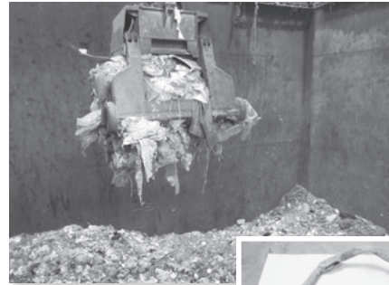
上/ピットに入れるごみ 右/焼却された空き缶など