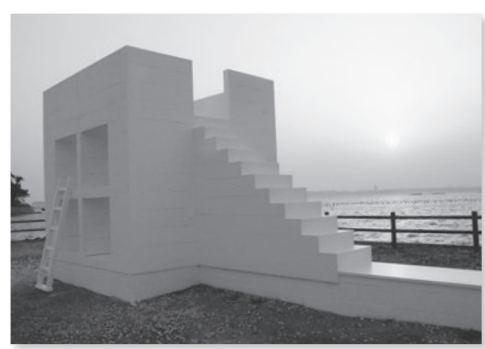
夕焼けに映える 真っ白なイーストハウス