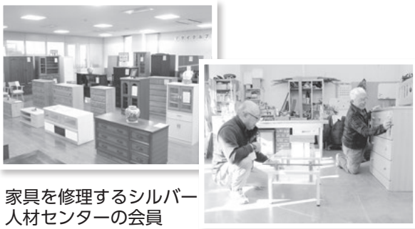
家具を修理するシルバー人材センターの会員

清掃や修理して再利用することは、簡単にできる「ごみの減量」です。リサイクルプラザを利用して、財布にも環境にも優しい取り組みをしてみましょう。