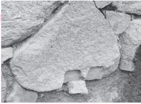
矢穴のある幡豆石

西尾市史の編さんと西尾城跡保存活用計画の策定のため、西尾城本丸裏門の発掘調査を3月5日から13日に行いました。今まで、二之丸や東之丸の発掘調査は行われてきましたが、本丸内部の発掘は今回が初めて。調査の結果、本丸の地山(自然面の堆積層)の上に約70センチメートルの造成層があることが分かりました。二之丸や東之丸にはなかったため、本丸は意図的に高く盛土されていたことが判明しました。また、石垣には幡豆石(吉良・幡豆地区の丘陵で産出される深成岩類)や領家変成岩(東部丘陵で産出される珪質片岩・雲母片岩など)、佐久石(佐久島で産出される泥岩)の3種類の石材が使われていたことが確認でき、城の近隣から石材を調達していたことが分かりました。