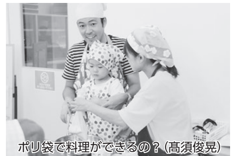
ポリ袋で料理ができるの? (高須俊晃)