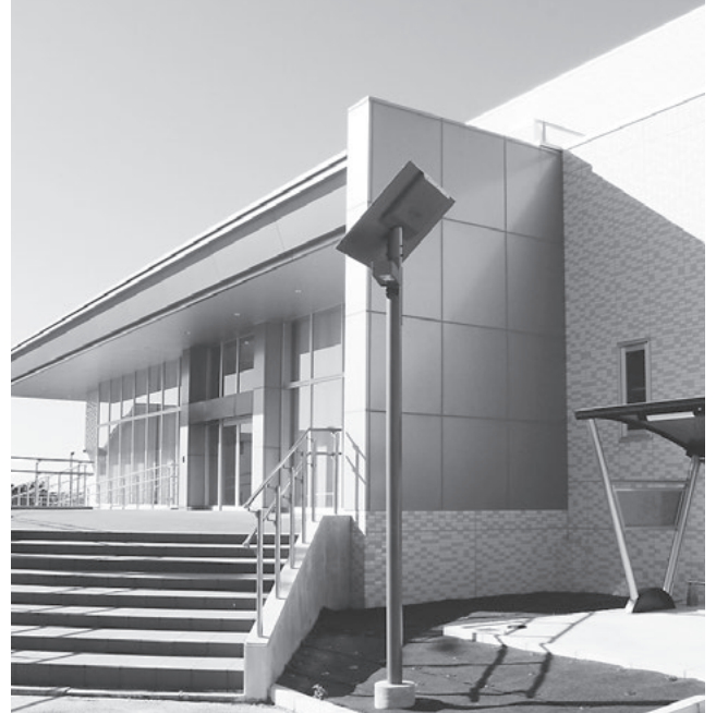
きら市民交流センター（仮称）支所棟