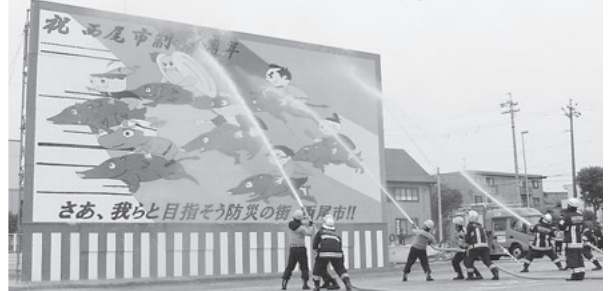
市消防本部総務課（☎56・6250）

内 機能別消防団員による徒歩部隊と消防車両23 台の分列行進や巨大かくし絵、消防職員のは しご乗り演技、一斉放水などを披露します。 子ども用の防火服を着て、消防車と記念撮影 や、「まーちゃ」や「ぼうサイくん」と一緒に 遊ぶコーナー、消防クイズ、おしるこの配布 など、さまざまなイベントを開催します。