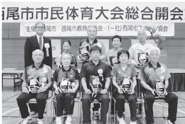
優秀選手、優秀チーム代表者の皆さん