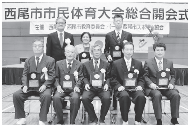
スポーツ功労賞の皆さん