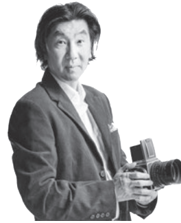
写真家 加藤慎一氏

昭和38年名古屋生まれ。ニューヨーク大学の大学院を卒業後、キャリアをスタート。現在は写真家として活動する傍ら、日本デザイナー学院、愛知工業大学などで授業を受け持つ。