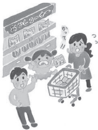
出典／厚生労働省「健やか親子21」

子どもに「イヤだ」と言われたら、戸惑うこともあるでしょう。2〜3歳の子どもの「イヤ」は自我の芽生えであり、成長の証です。子どもの考えを引き出し、必要に応じて手助けしながら、子どもの言い分を気長に聞きましょう。「わがままな子にならないように」と親は指示的に対応してしまうかもしれませんが、子どもの成長だと思い、子どもの意思を後押ししてください。