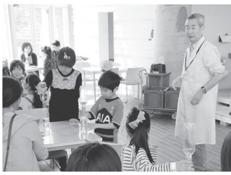
問 愛知こどもの国 (☎62・4151)

対 3歳以上の方 時 10月5日(土)～27日(日)の土・日曜日、祝日 午前10時～午後4時30分 場 中央管理棟(2階) 内 ①実験キット：20種類の実験キットで遊びながら子どもたちの好奇心を育てまます。 ¥ 無料 他 事前申し込み不要