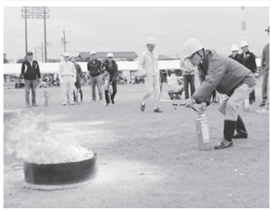
初期消火訓練の様子

誰もが安心して避難生活を送ることができるよう、近所に住んでいる人たちと、互いに助け合い、支え合える関係を作り、地域一体となって災害を乗り越えましょう。