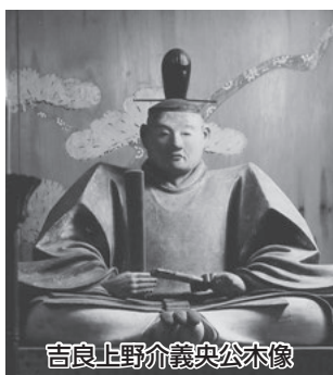
吉良上野介義央公木像