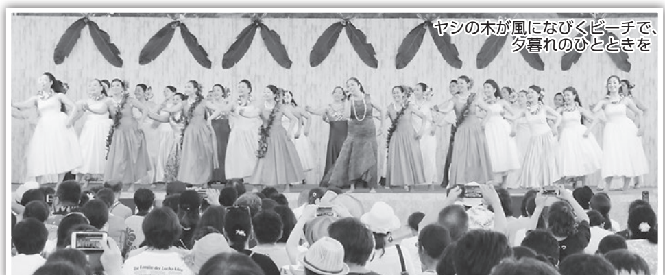
ヤシの木が風になびくビーチで、夕暮れのひとときを