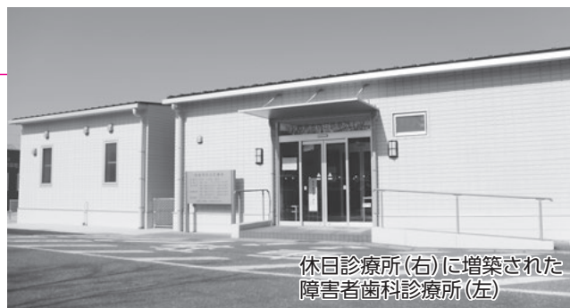
休日診療所(右)に増築された障害者歯科診療所(左)

予約方法 4月1日(月)以降の月～金曜日午後1時30分～4時30分に、電話で障害者歯科診療所(☎54・4182)へ。