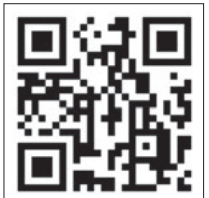
みどり川棧敷予約専用ページ QRコード

申 3月8日(金)～4月7日(日)に、株式会社城下町PRIDEみどり川棧敷予約専用ページ( http://reserva.be/pride1203 )で申し込んでください。棧敷席の予約について詳しくは、同社(☎77・8650/桜木町)へお問い合わせください。