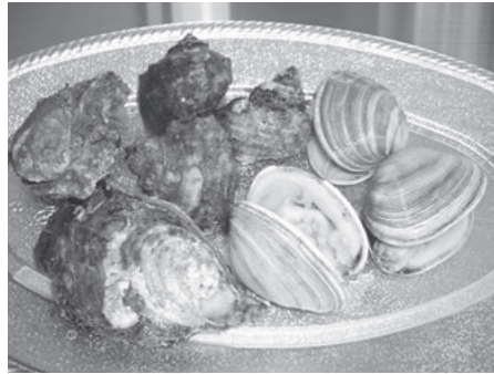
採れたてで身がぷりぷり。佐久島ならではの新鮮な貝をご賞味あれ！