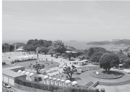
眺望の良さもこどもの国の魅力

②木の葉でビンゴ ③冬の森の観察会「カブトムシ幼虫探し」(9日・10日のみ) ④