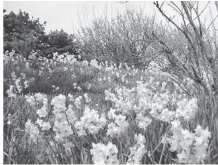
大島公園に咲き誇るスイセン。奥には梅がきれいな赤い花を付けています