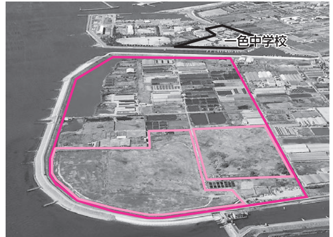
□ 産廃処分場の跡地 □ 新たな産廃処分場の計画地