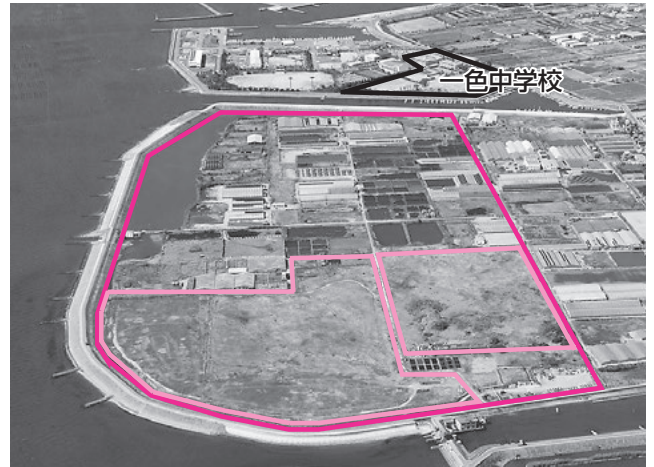
□ 産廃処分場の跡地 □ 新たな産廃処分場の計画地