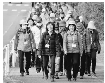
笑顔で楽しくウォーキング 多い時には約100人が参加

ウォーキングを楽しんでいます。申し込みが不要のため、気軽に参加できると好評です。また、7・8月の暑い時期には、室内で体操を行っています。