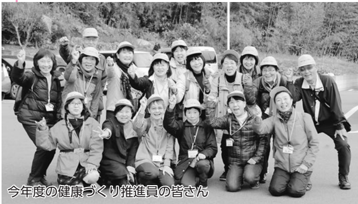
今年度の健康づくり推進員の皆さん

31年度西尾市健康づくり推進員を募集します。「健康について正しい情報を知りたい」「生涯健康で元気に暮らしたい」「今までの経験を生かしたい」「地域を元気にしたい」など、健康づくりに関心のある方は、ぜひご応募ください。 健康づくりの秘訣と生きがいを手に入れて、自分を輝かせてみませんか。