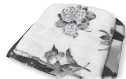
バスタオルで作った鍋の保温カバー

るといふ参加者は「みんなと話しながら手を動かすのが楽しい。これからも参加したい」と話してくれました。