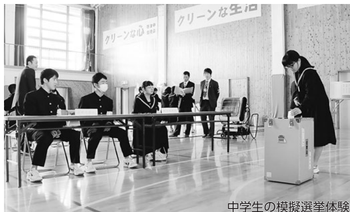
中学生の模擬選挙体験