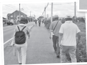
避難経路を歩き、危険箇所を確認する地域の皆さん