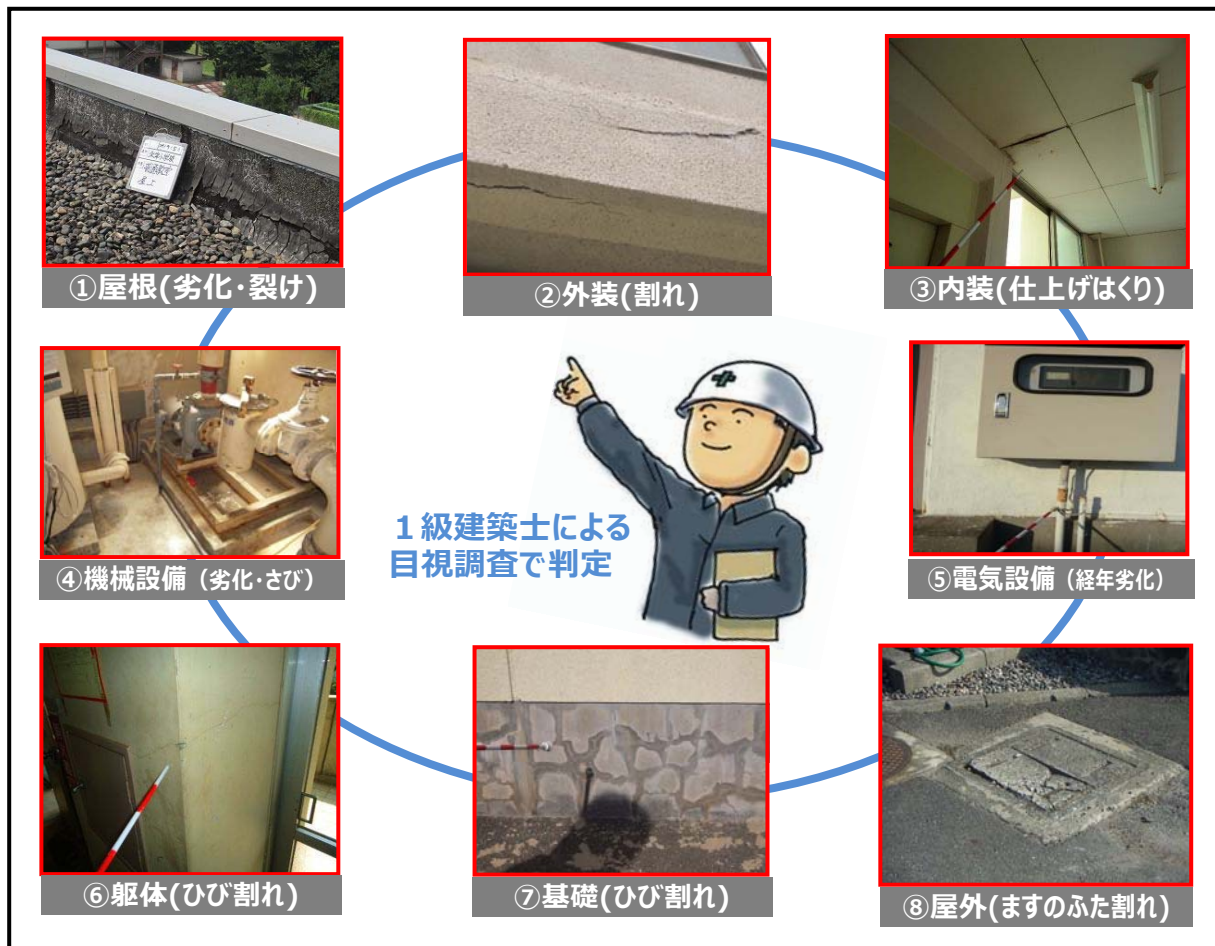
（図表3-6）建築物劣化調査方法（イメージ図）

（注1）一般財団法人 建築保全センター 官公庁施設の維持管理や改修など保全に関する調査研究・企画立案・技術開発などの業務を通して公共建築物の適正な保全を支援する団体で、かつては国土交通省所管の財団法人だったが公益法人制度改革に伴い平成24年に一般財団法人へ移行した。