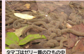
タマゴはゼリー質のひもの中