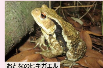
おとなのヒキガエル