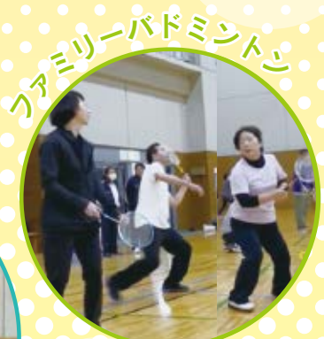
ファミリーバドミントン