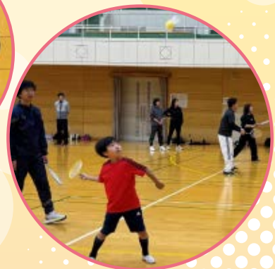
練習の成果を発揮!