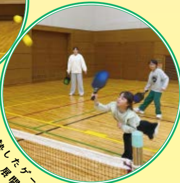
白熱したゲームを展開