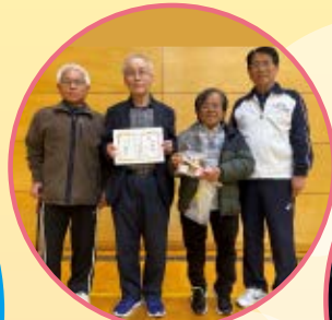
おめでとうございます★