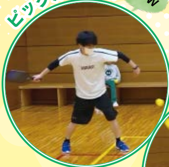
初心者から経験者までみんなで楽しめる!

新種目「ピククルボール」をはじめ3種目の体験会を開催。スポーツを楽しむきっかけを提供できました。