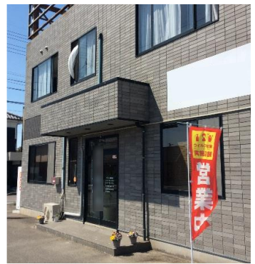
「高齢者にやさしい店舗」ステッカー