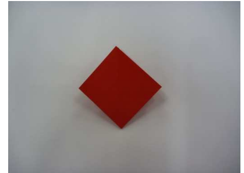
④もうかたほうもひらく