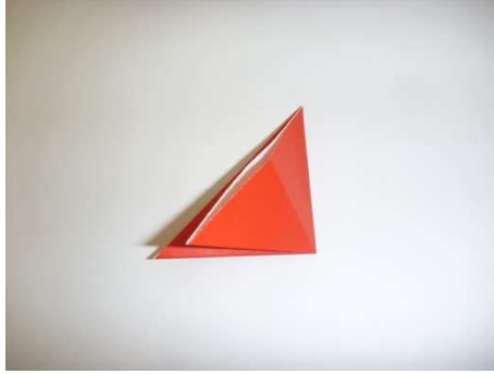
②①をさらにふたつにおる