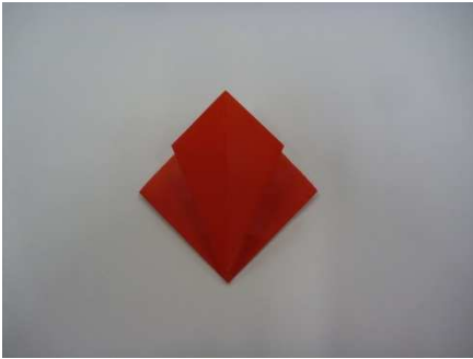
⑤りょうはしをうちがわに おりこむ