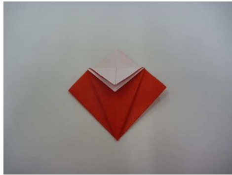
⑥うえの2まいをてまえにおる