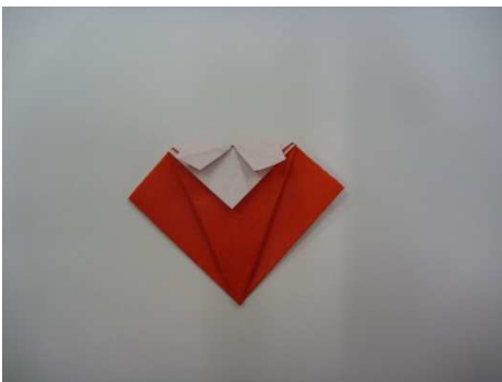
⑨おったところをひらく