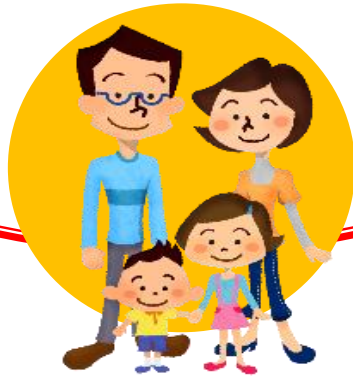
依頼会員と援助会員を兼ねる人