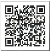
Cách đăng ký tiêm

[Chú ý] Những mũi tiêm mà được Nishio shi gửi giấy thông báo về cho thì là 0 yên.