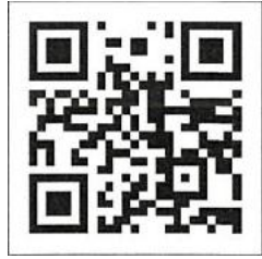
Mã QR của ứng dụng にし MO

[?] Những lúc như thế này thì hãy liên lạc hỏi Hoken center