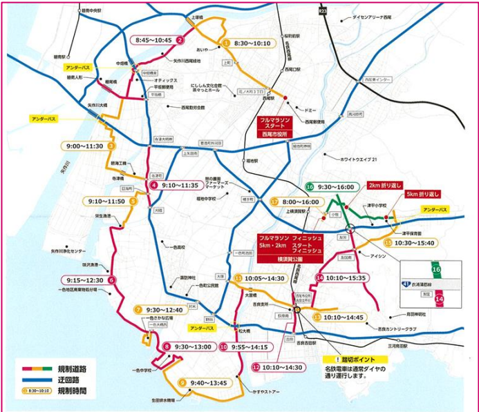
Mapa indicativo das vias públicas a serem interditadas no dia da maratona ➡

Será um evento de maratona que circunda o município de Nishio. Neste dia, as ruas ficarão interditadas conforme mapa ao lado, entre 8h e 16h. Utilizar as vias públicas indicadas em azul.